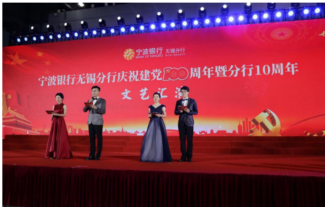
2021年6月27日，无锡分行举行庆祝建党100周年暨分行成立10周年文艺汇演，分行全体员工及家属代表共计1200余人参加活动