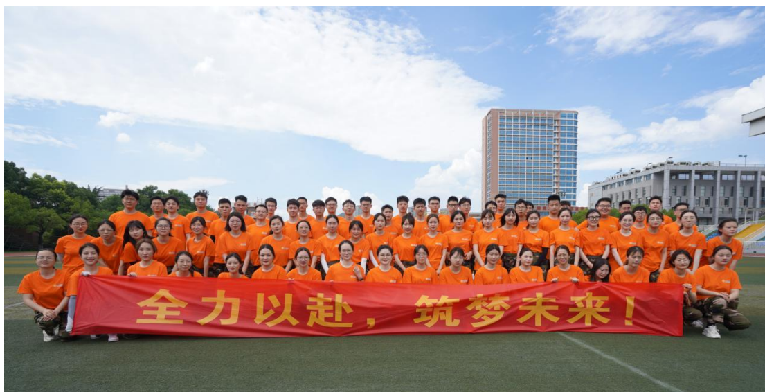
杭州分行开展 2021 年校招新员工集训

二是建设完善学习资源。全行现有内部讲师 5000 余人，较 2020 年新增 30%，建立了相应的讲师津贴、职级晋升等激励保障；现有带教导师 6500 余人，为新员工成长提供引导和支撑；全行课程总量超 1600 门，按条线、关键岗位分门别类，覆盖专业知识、通用技能等各类主题，满足员工能力提升需求；手机学习平台集成自选课程、智能话术陪练、闯关测验等多重功能，为员工提供碎片化移动学习渠道。