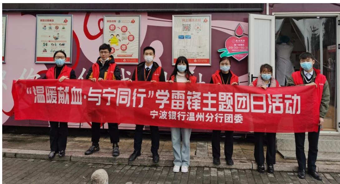
2021 年 3 月 5 日，温州分行 46 名青年党团员分批前往温州火车南站献血屋献血

我行在各营业网点设立志愿者服务站点，做到学雷锋志愿服务“有人”“有岗”“有志愿服务内容展示”的三有服务，并由大堂经理担任学雷锋志愿服务岗，佩戴“学雷锋志愿者”绶带、徽章，开展志愿服务活动。