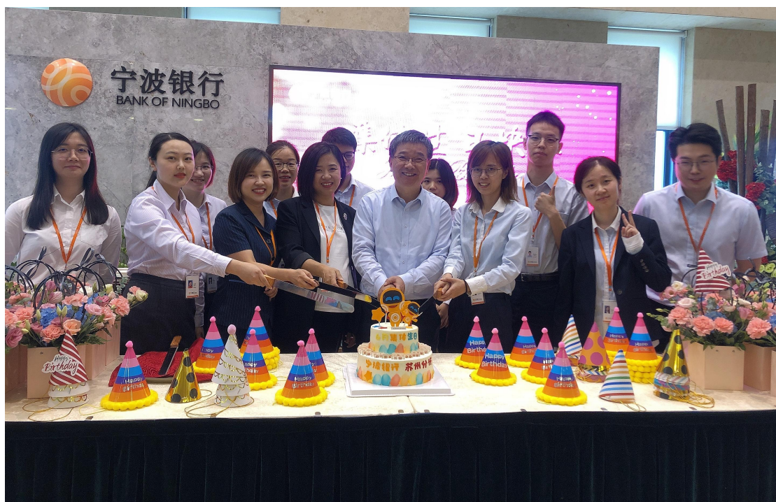
2021年6月11日中午，苏州分行举办6月员工集体生日活动，为当月生日的员工庆生