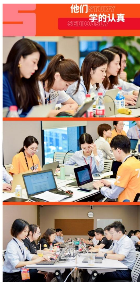
2021 年“榜样力量”巡讲团选拔剪影