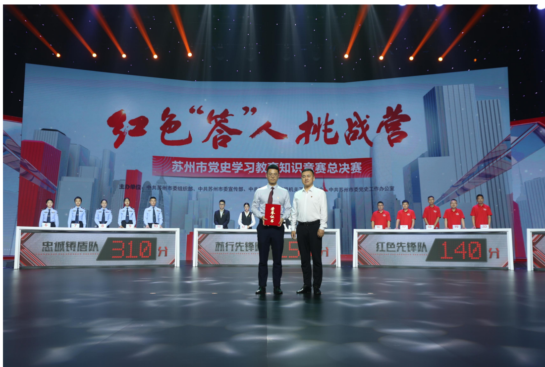
2021年，苏州分行与中共苏州市委组织部、宣传部、市级机关工委和党史工办、苏州广电联合举办苏州市“四史”学习教育活动