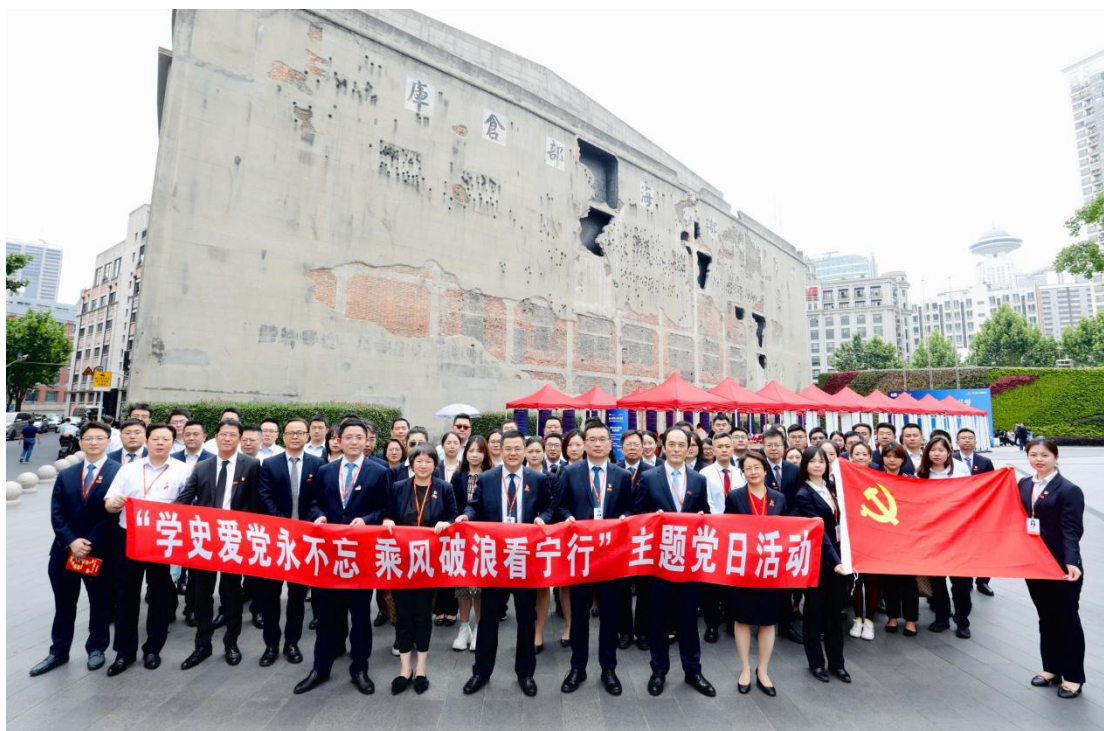
2021年5月18日，上海分行党委举办“学史爱党永不忘，乘风破浪看宁行”四行仓库纪念馆参观活动