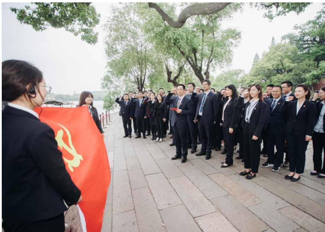
2021年4月24日，嘉兴分行党委、各支部委员、党员干部代表在南湖红船旁重温入党誓词

三是多措并举提升党史学习教育成效。积极开展“我为群众办实事”、“党课下基层”等活动，把开展党史学习教育与推进银行经营发展紧密结合。