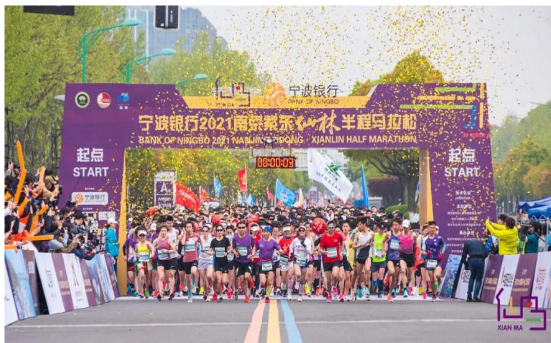
2021 年 4 月 11 日，宁波银行 2021 南京紫东·仙林半程马拉松在羊山公园鸣枪开跑

我行大力支持公益事业，不断拓宽公益视野和渠道，参加了各类公益活动，支持社会公益发展壮大。